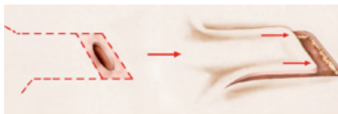
exemple de plastie locale : avancement d'un lambeau cutané

Dans les cas où la taille de la lésion ou sa localisation rendent irréalisable une fermeture par suture directe, la couverture de la zone retirée sera assurée soit par une greffe de peau prélevée sur une autre région, soit par une plastie locale qui correspond au déplacement d'un lambeau de peau avoisinant afin que celui-ci vienne recouvrir la perte de substance cutanée (cf schéma ci-après). La rançon cicatricielle de ce type de lambeau est bien sûr plus importante, mais, réalisé dans les règles de l'art, les résultats esthétiques à terme sont toutefois souvent meilleurs que ceux d'une greffe.